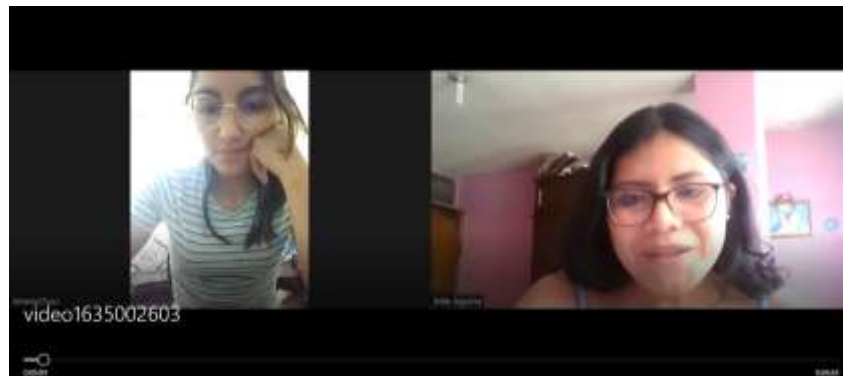
Imagen 2 Entrevista 2