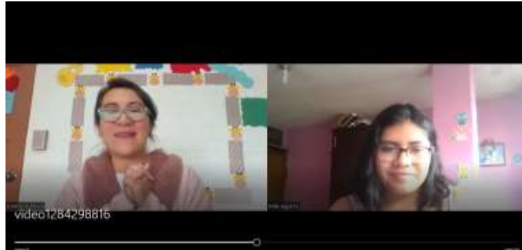
Imagen 1 Entrevista 1