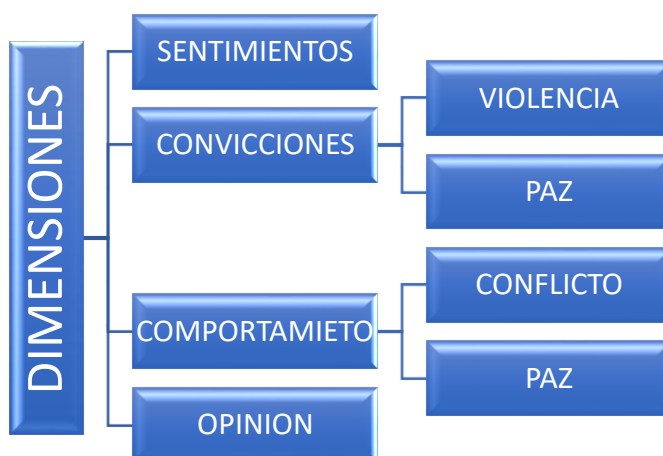
Figura 1. Categorización

Se realizó un estudio que involucró a 10 padres de familia con hijos en la etapa de infancia en el cantón Latacunga, específicamente en la parroquia Juan Montalvo. La información se recolectó a través de entrevistas. A continuación, presentamos la tabulación de los datos recopilados, organizados en 4 dimensiones.