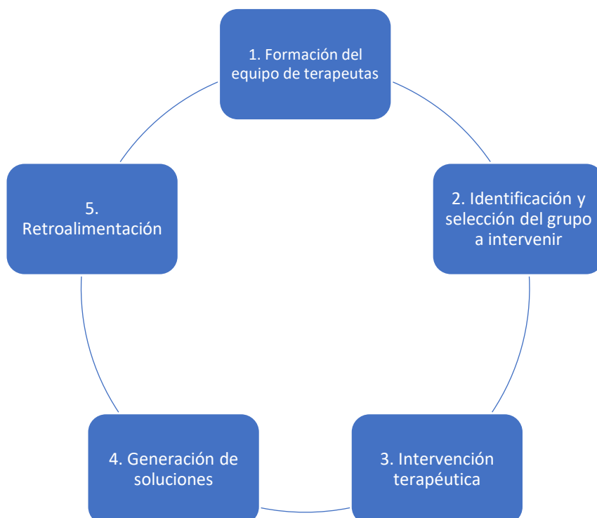
Pautas de la Terapia Comunitaria Integrativa