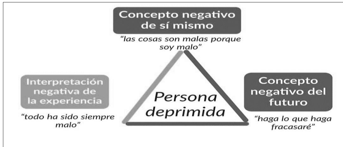
Figura N° 2. Triada cognitiva de Beck