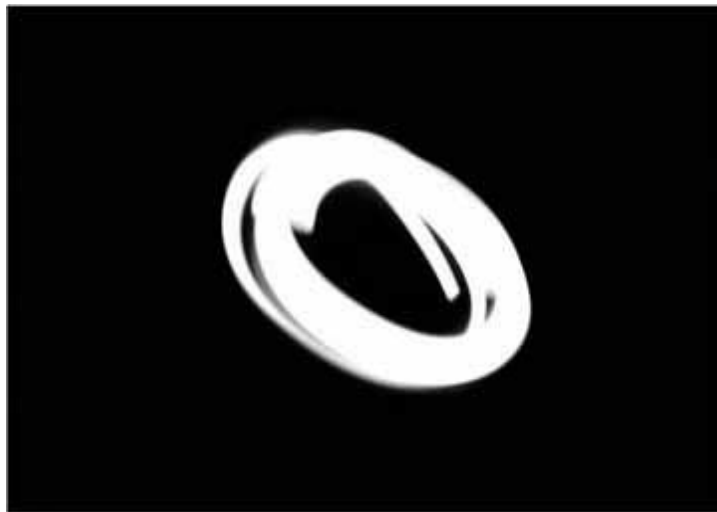
Figura N° 4. Linterna girando en la oscuridad