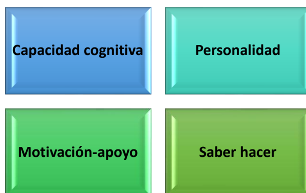
Gráfico 2 Factores asociados al rendimiento académico

En el rendimiento académico influyen factores como el autoestima, estimulación, aptitudes, intereses propios, autodeterminación, hábitos de estudio, relación familiar, relación familia-profesor, relación padre-profesor, sin embargo, la inteligencia y capacidades, motivación, personalidad son consideradas variables claves y predictores del rendimiento académico. (29).