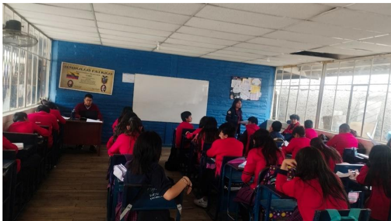
Estudiantes de Noveno año de Educación Superior de la Unidad Educativa “Ambato de los Ángeles”