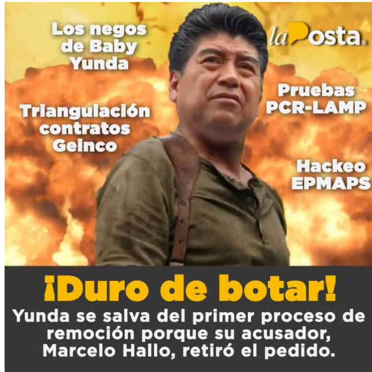
Figura 7. Duro de botar.