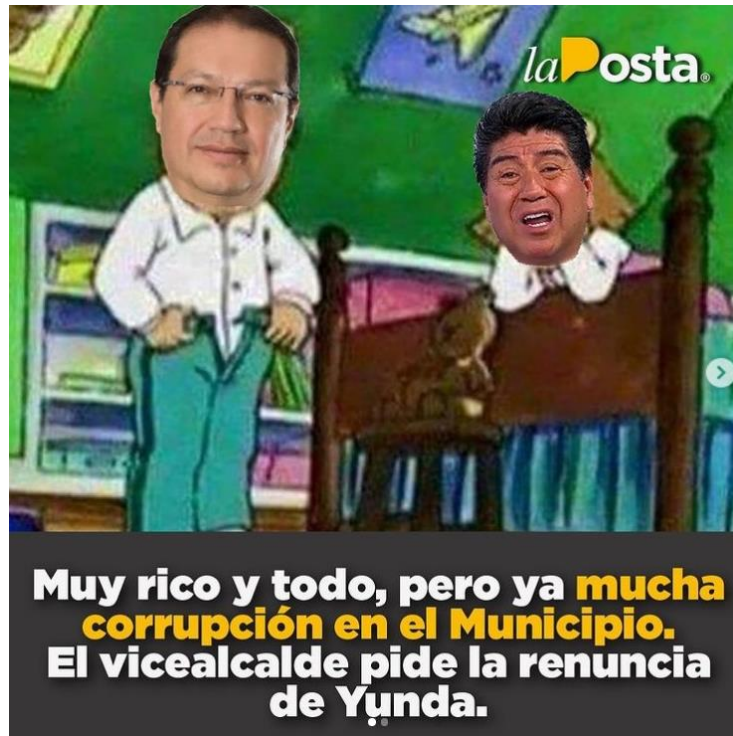
Figura 5. Vicealcalde pide la renuncia de Yunda.