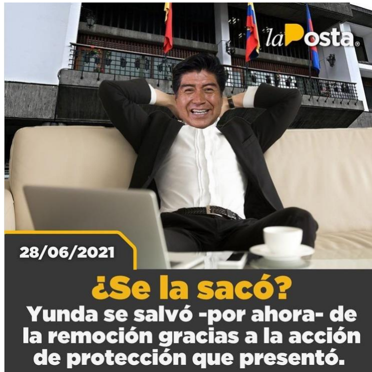
Figura 9. Yunda se salvó de la remoción.