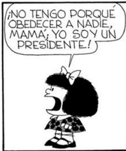
Figura 2. Mafalda.

De igual manera se la emplea con intenciones burlescas para comentar situaciones relacionadas con el poder, para criticarlo o exponerlo desde la informalidad, “la sátira se manifiesta mediante la risa ridiculizante y la burla. Existe una exageración de rasgos, que son pública e hiperbólicamente expuestos (Urbanitsch, Feldman, Santa Cruz, 2016, p. 6 como se citó en Hutcheon, 2000)”. Finalmente, requiere ser un contenido fácil de reconocer y entender como grotesco, pero debe contener un grado de ética. En los siguientes apartados se mencionará algunos escenarios donde la sátira se despliega.