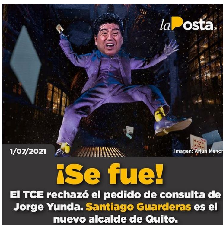
Figura 10. El TCE rechazó el pedido de consulta de Jorge Yunda.