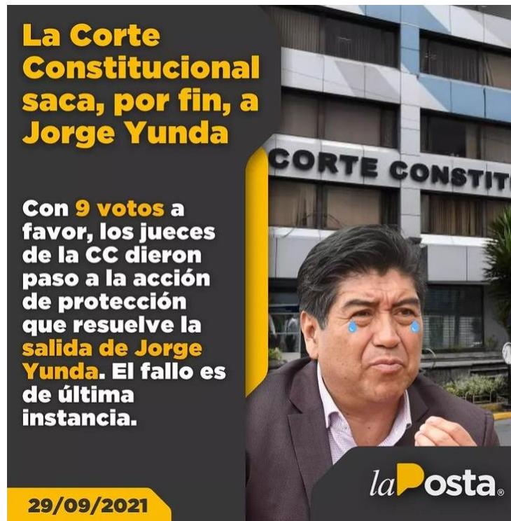
Figura 12. Jorge Yunda debe dejar la Alcaldía.