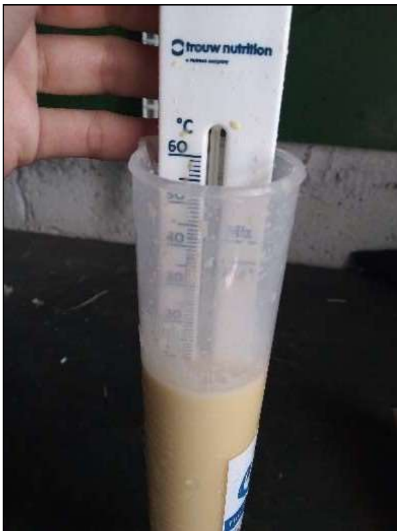
Foto 10. Ingreso del calostrómetro y lectura de valores