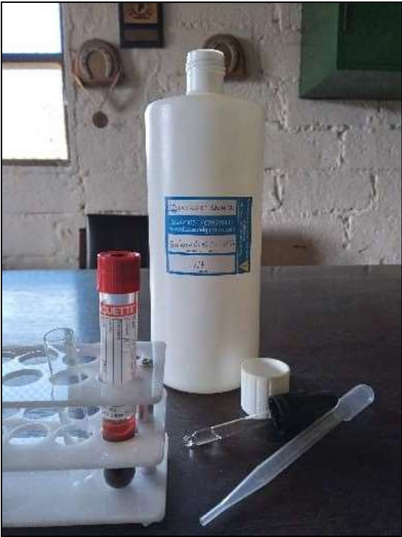
Foto 14. Gelificación del suero sanguíneo