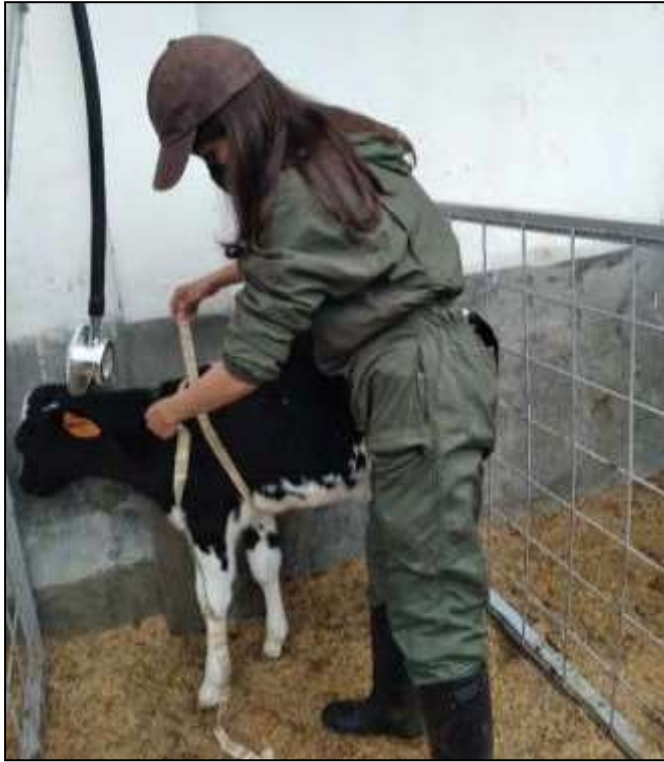
Foto 16. Altura