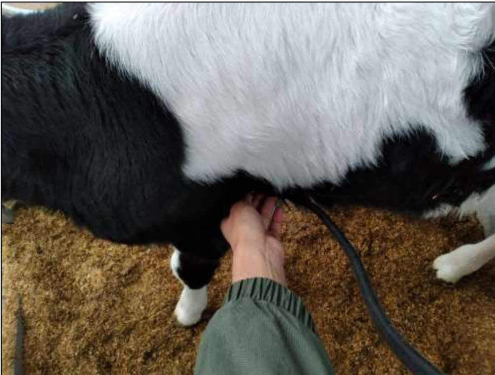
Foto 18. Frecuencia respiratoria