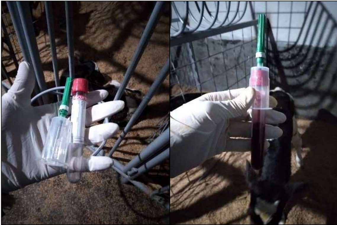
Foto 12. Muestra de sangre en reposo