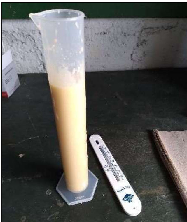
Foto 8. Calostro en probeta