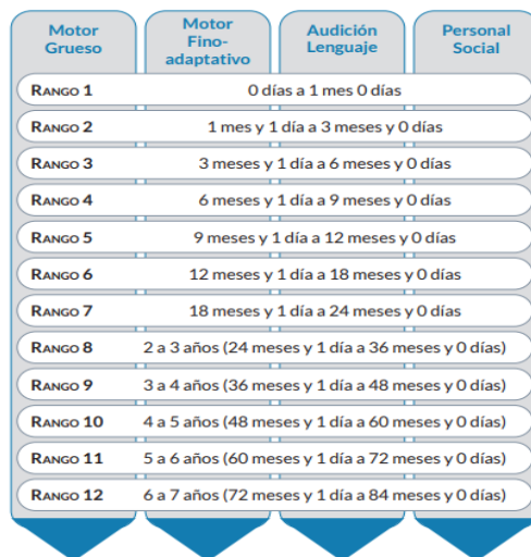
Estructura del Test-escala abreviada de desarrollo de Nelson Ortiz

Nota: La gráfica muestra los rangos e ítems que estructuran el Test-escala abreviada de desarrollo de Nelson Ortiz