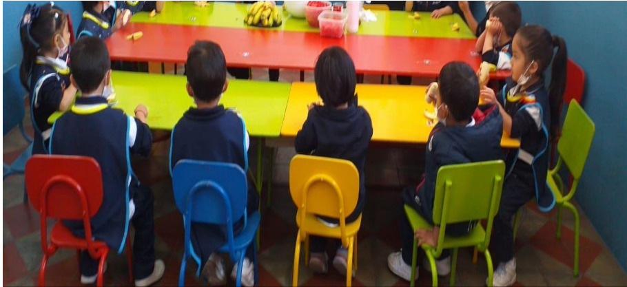
Figura 15 Actividad 12