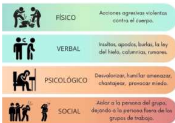
Figura 1 Tipos de Bullying