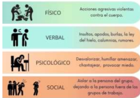
Figura 3 Tipos de Bullying