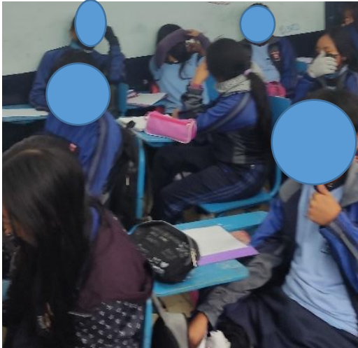
Gráfico 5 Aplicación de la escala de EVEA