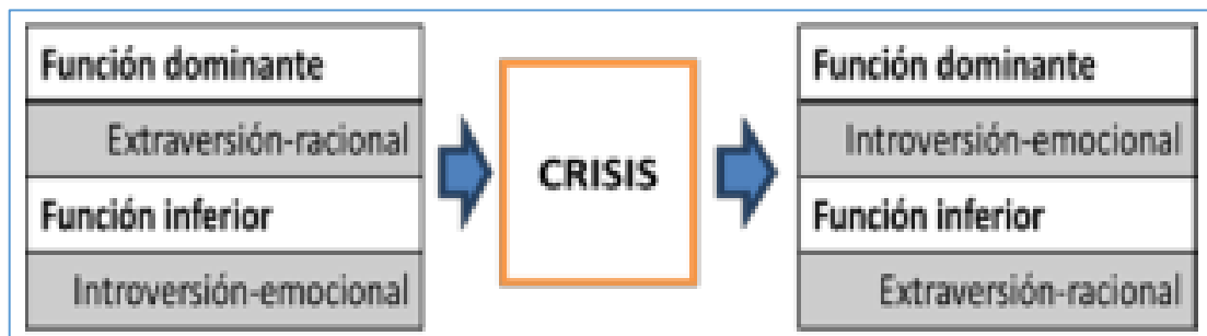
Gráfico 1 Teoría de Jung

Si una persona tiene la extraversión-razón como función dominante, su función inferior será la introversión emoción, que complementa la función principal, dando como resultado un equilibrio de fuerzas psicológico. Ahora bien, en una situación crítica o de estrés agudo, es probable que emerja con más determinación la sombra, es decir, la función inferior. Incluso es posible que, durante un tiempo, la función inferior ocupe el lugar de la función dominante, para, más adelante y una vez superada la crisis, volver a su posición original (Amigó et al., 2018).