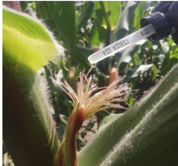
Aplicación de aceite vegetal con gotero