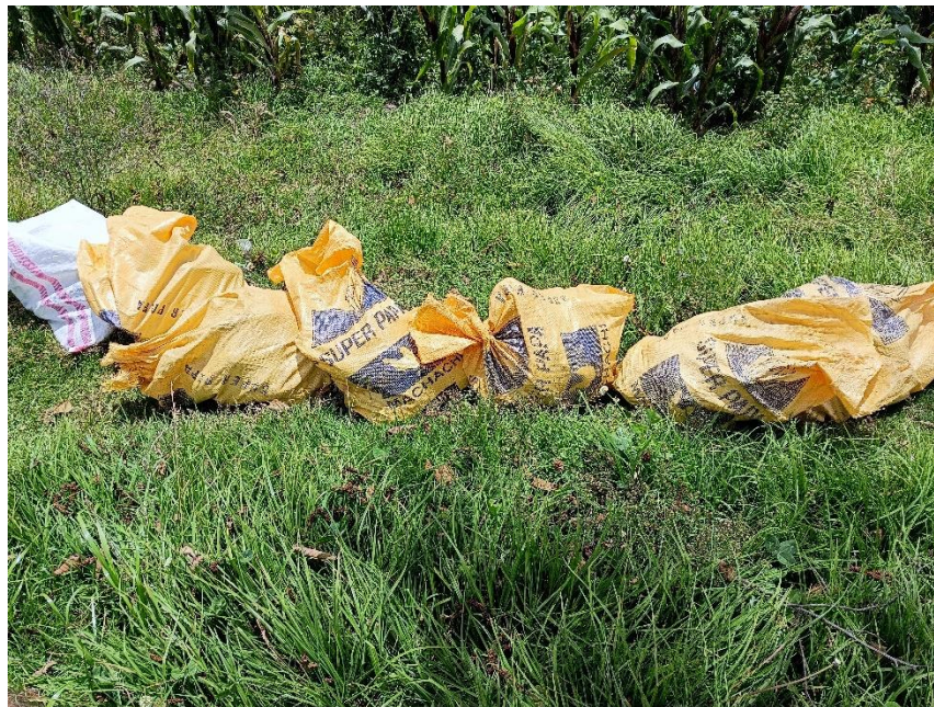
Cosecha de mazorcas en sacos según su tratamiento