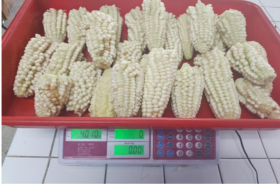
Toma de peso de las mazorcas por unidad experimental