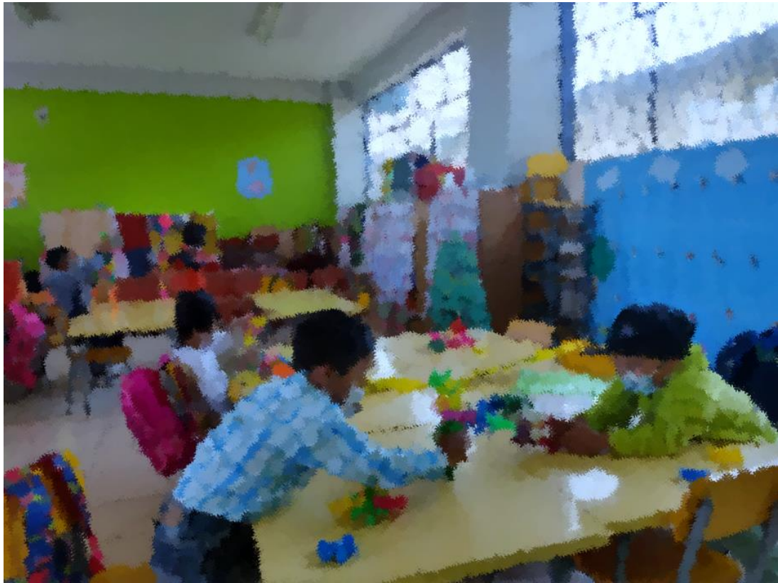
Figura 3: Desarrollo de actividades