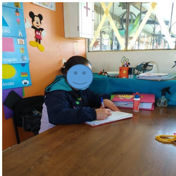
Figura 1: Entrevista dirigida a las docentes